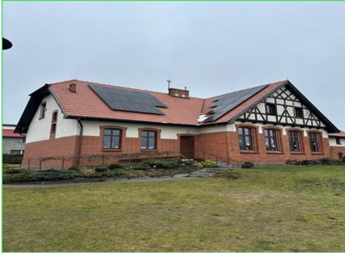
Świetlica wiejska w Brzoziu

wiejskich: Brzozie, Ludwichowo, Ostrowo, Zalesie oraz budynku „Starej Szkoły” w Trzebcinach, w ramach projektu „Dostawa i montaż instalacji fotowoltaicznych na terenie gminy Cekcyn do obiektów będących własnością gminy” współfinansowanego z Programu Inwestycji Strategicznych, Rządowego Funduszu Polski Ład.