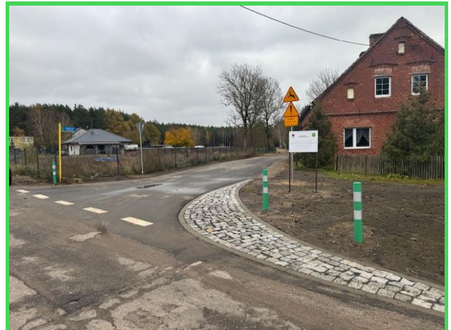
Nowa droga w miejscowości Brzozie

W 2025 roku otrzymaliśmy dofinansowanie na kwotę 2 273 982,00 zł w ramach Rządowego Funduszu Rozwoju Dróg (nabór 1/2024/RFRD) na realizację inwestycji pn. „Rozbudowa drogi gminnej nr 010314C przez miejscowość Suchom i Lisiny”. Na początku 2025 r. zostaliśmy zakwalifikowani na listę rezerwową zadań wskazanych do dofinansowania w ramach Rządowego Funduszu Rozwoju Dróg (nabór 1/2024/RFRD) Ww. inwestycja mieściła się na 38 pozycji listy. W sierpniu 2025 r. udało się podpisać umowę z Wojewodą Kujawsko -Pomorskim na powyższe zadanie na kwotę 2 273 982,00 zł. W styczniu 2025 r. złożyliśmy wniosek do Zarządu Województwa Kujawsko – Pomorskiego o współrealizację zadania dotyczącego budowy lub modernizacji drogi dojazdowej do gruntów rolnych planowanej w