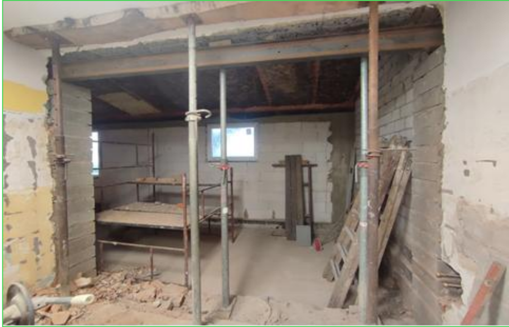
Budynek świetlicy w trakcie rozbudowy