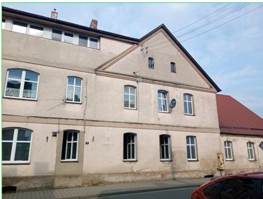
Budynek przed inwestycją