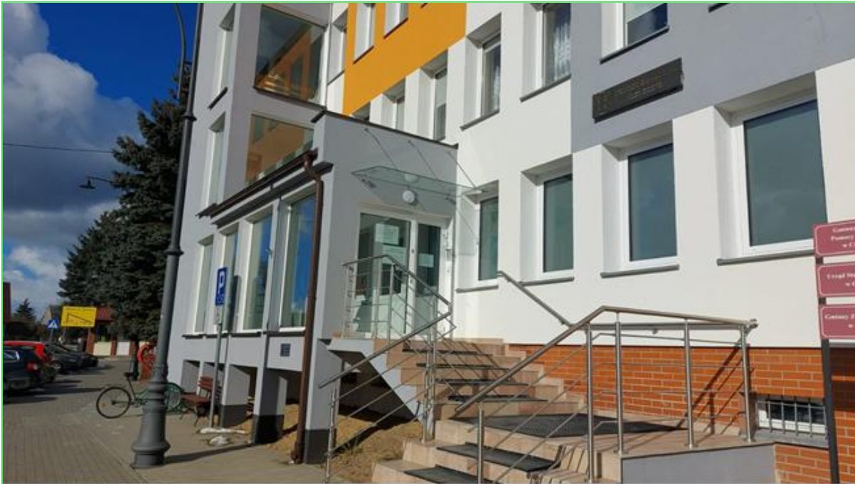
Nowa elewacja na budynku Urzędu Gminy

W ramach remontu budynku administracyjnego Urzędu Gminy wymieniono instalację elektryczną, zamontowano instalację przeciwpożarową, wykonano klimatyzację, nową elewację budynku oraz wybudowano podjazd dla niepełnosprawnych. Kwota zadania: 1.189.400,00 zł. Termin realizacji: 22.04.2025 r.