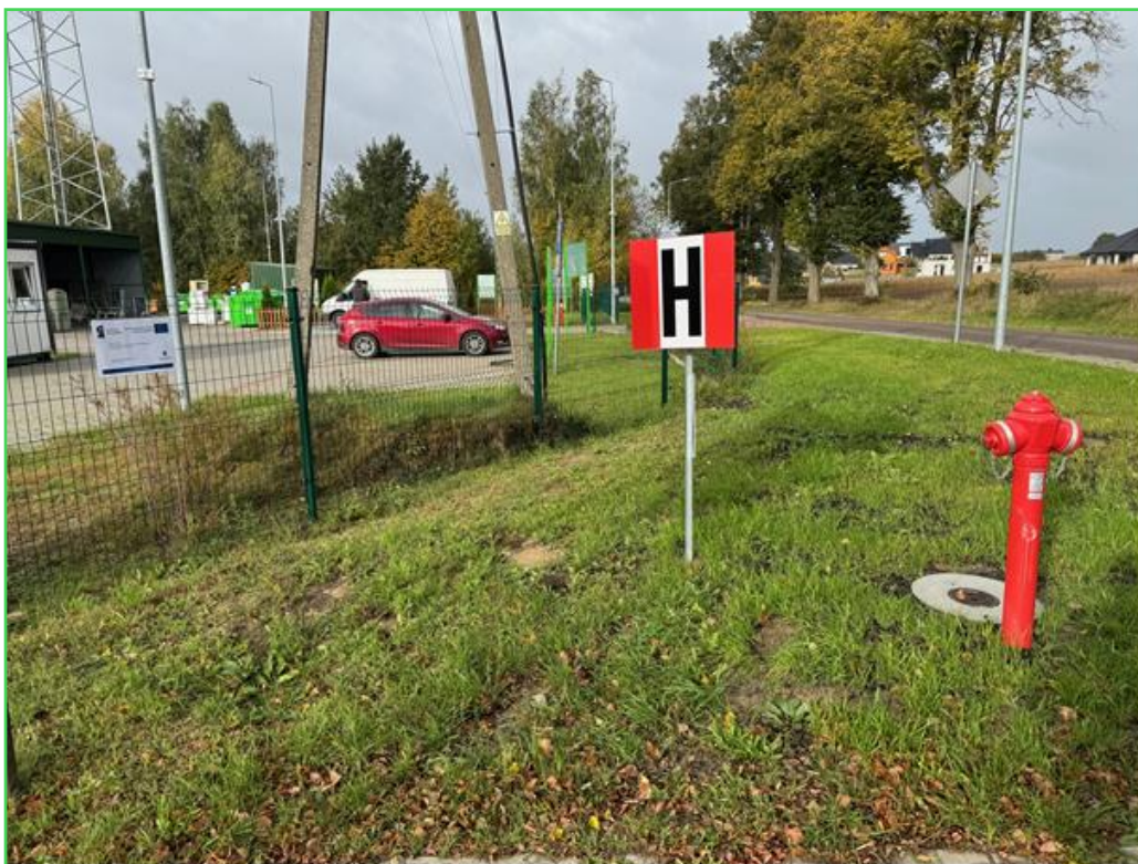
Hydranty zewnętrzne

Przebudowa sieci wodociągowej w ul. Kanałowej w Cekcynie – w ramach zadania przebudowano odcinek sieci wodociągowej w ul. Kanałowej w Cekcynie o długości ponad 700 metrów, gdzie azbestowe rury zostały zastąpione nowoczesną siecią. W ramach inwestycji wykonano również nowe przyłącza do sąsiadujących posesji oraz zamontowano hydranty nadziemne. Całkowita wartość projektu wyniosła 242 073,86 zł, z czego 167 597,10 zł stanowiło dofinansowanie pozyskane przez Gminę Cekcyn z Europejskiego Funduszu Rozwoju Regionalnego.