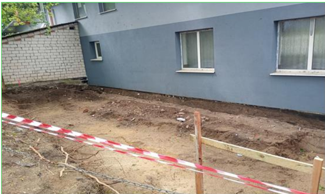
Wytyczenie pod rozbudowę budynku wielofunkcyjnego w Iwcu

1. Rozpoczęliśmy rozbudowę budynku wielofunkcyjnego w Iwcu o pomieszczenia kuchenne, magazynowe, powiększenie metrażu dużej sali oraz toaletę na parterze. Powierzchnia użytkowa budynku zwiększy się o 31,76 m 2 . Prace budowlane były i są wykonywane społecznie przez mieszkańców i lokalne firmy z sołectwa Iwiec, a obecnie przez pracowników brygady remontowo – budowlanej Urzędu Gminy przy pomocy mieszkańców sołectwa Iwiec.