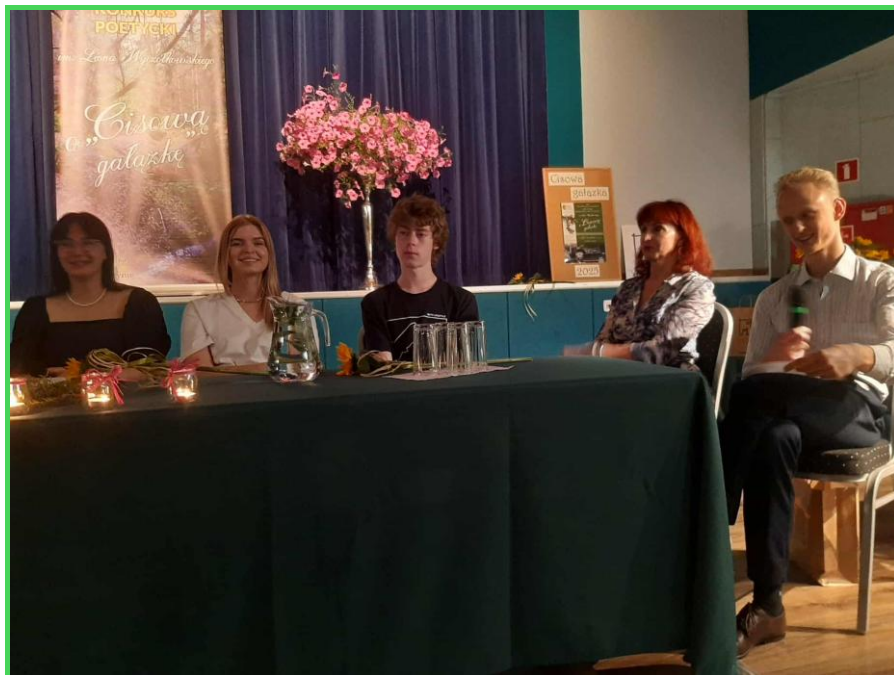
Laureaci Konkursu „O Cisową Gałązkę