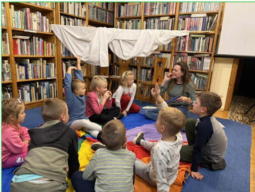
Zajęcia dla najmłodszych w ramach Nocy Bibliotek