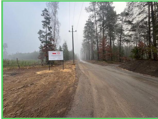
Nowa droga w Suchomiu i Lisinach