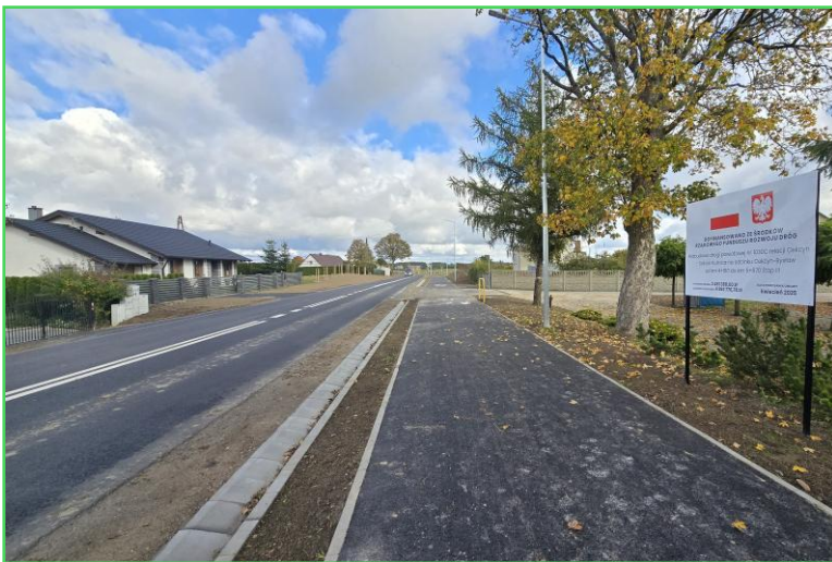
Wyremontowany odcinek drogi do Bysławia

Rozbudowa drogi nr 1030C RELACJI Cekcyn - Sokole Kuźnica na odcinku Cekcyn – Bysław, etap II - długość odcinka 1.690 m, wartość inwestycji: 4.962.776 zł, dofinansowanie: Rządowy Fundusz Rozwoju Dróg (50%) – 2.481.388 zł, wkład własny: 2.481.388 zł, termin realizacji: do 19.09.2025 r., wykonawca: REDON NAKŁO Sp. z o.o.