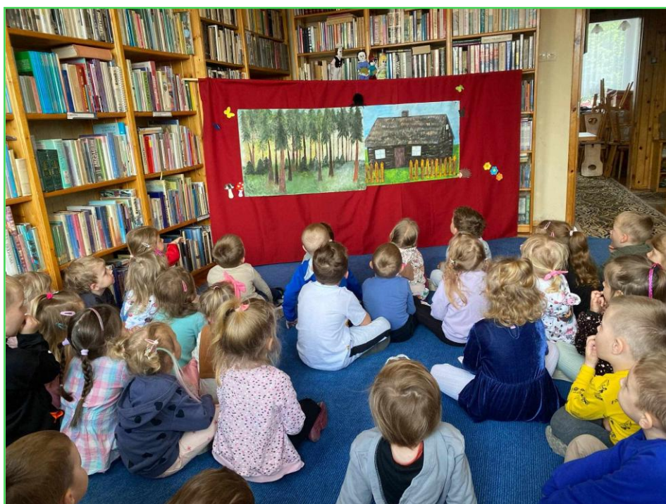
Zajęcia dla dzieci w ramach Tygodnia Bibliotek – fot. GBP w Cekcynie

• w ramach Tygodnia Bibliotek w bibliotece przygotowany został teatrzyk kukielkowy, w którym uczestniczyły dzieci z cekcyńskiego przedszkola (scenariusze bajek oparto na dostępnych w bibliotece książkach dla dzieci). Z teatrzykiem bibliotekarki pojechały również do dzieci przedszkolnych w Iwcu i w Zielonce,