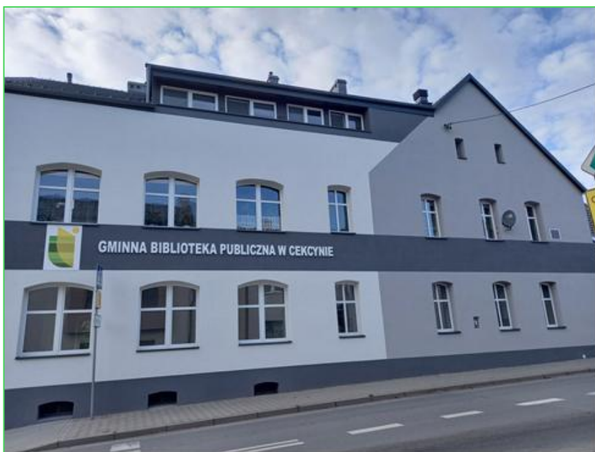
Budynek po remoncie

Gminna Biblioteka Publiczna w Cekcynie otrzymała dotację z budżetu gminy w wysokości 233.000,00 zł. oraz dotację, w wysokości 4.200 zł z Biblioteki Narodowej, w ramach Narodowego Programu Rozwoju Czytelnictwa 2.0, przeznaczoną na zakup nowości oraz zdalnego dostępu do publikacji elektronicznych.