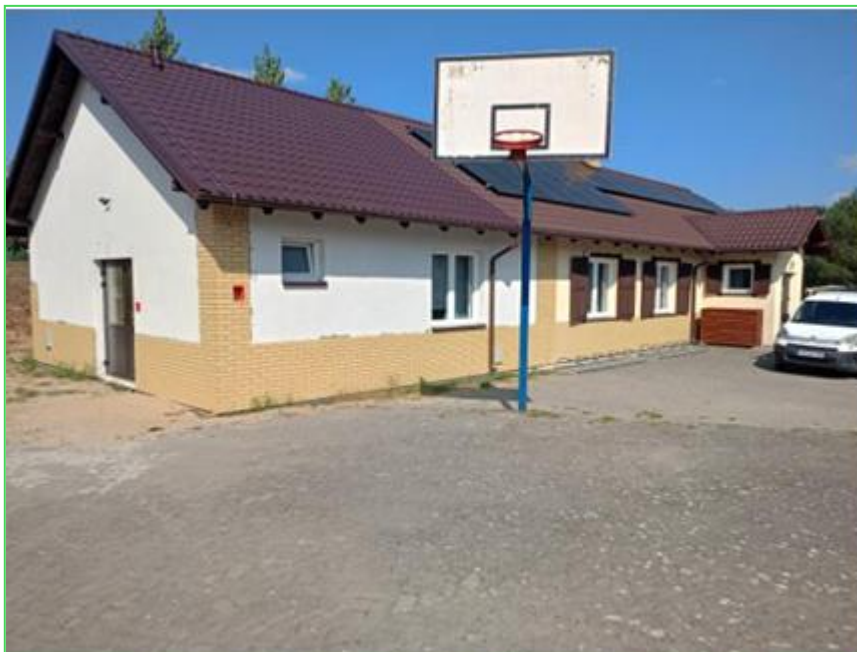
Budynek świetlicy w Wysokiej po rozbudowie