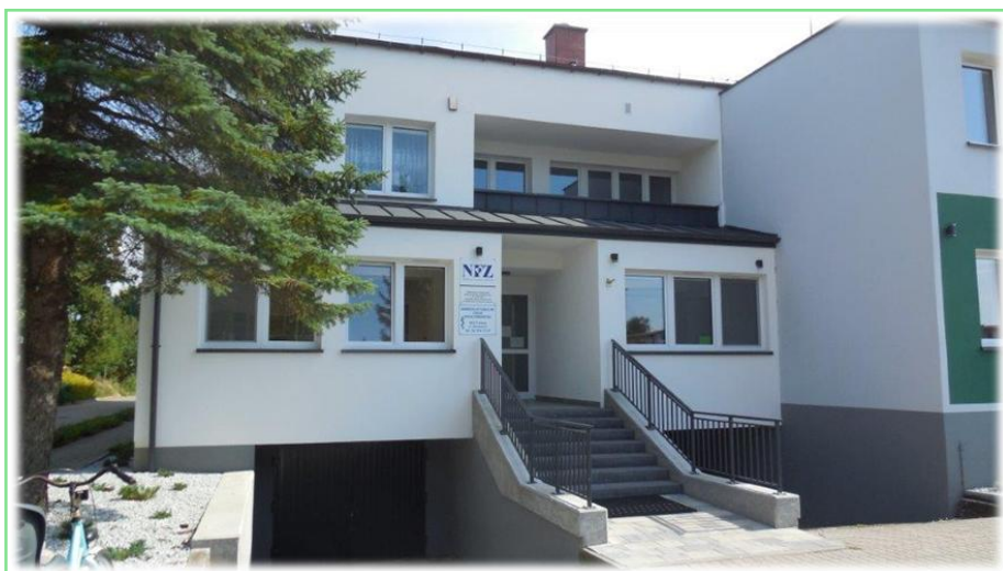
Przebudowany obiekt przychodni

W ramach zapewnienia dostępności architektonicznej dla osób ze szczególnymi potrzebami w 2025 roku zakończono przebudowę Urzędu Gminy w Cekcynie oraz budynku Samodzielnego Publicznego Zakładu Opieki Zdrowotnej, na które otrzymano dofinansowanie w kwocie 2.000.000 zł z Programu Polski Ład.