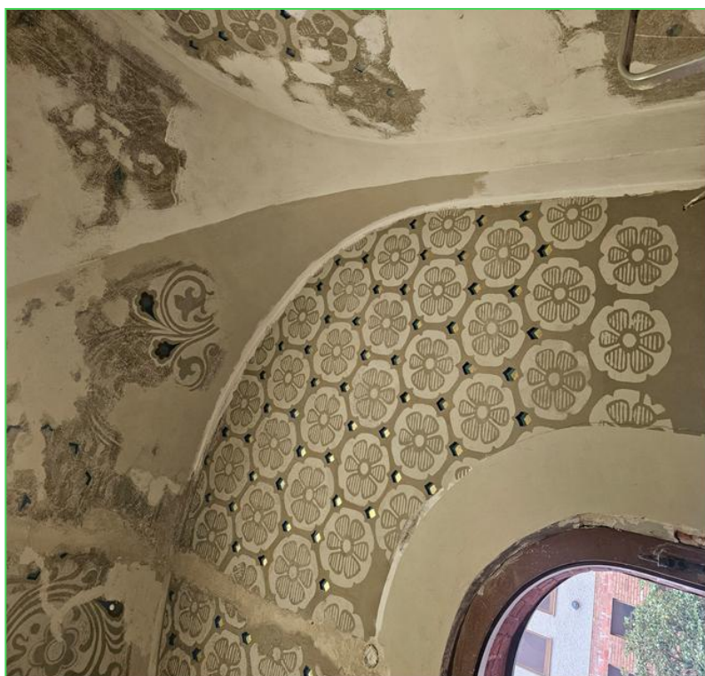
Prace konserwatorskie – w zakrystii Kościoła w Cekcynie

W 2025 roku w Kościele Parafialnym pw. Podwyższenia Krzyża Św. w Cekcynie kontynuowano prace restauratorskie i konserwatorskie głównie w zakrystii kościoła. Konserwator sztuki dokonała odtworzenia malowideł ściennych do stanu pierwotnego. Zadanie było finansowane ze środków Parafii. Poniższe zdjęcia prezentują stan wykonanych prac w zakrystii kościoła.