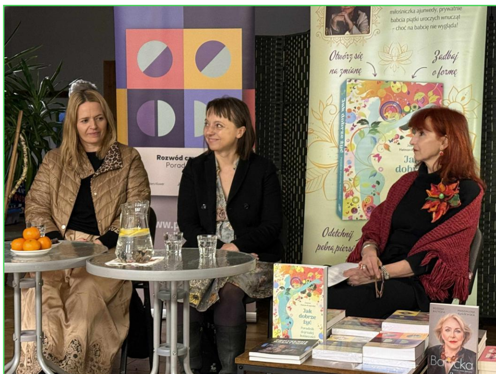
Spotkanie autorskie „Czułość i dojrzałość – Twoje supermoce”

Oprócz tradycyjnego czytania, biblioteka wspiera również czytanie on-line, udostępniając czytelnikom kody do portalu Legimi oraz umożliwia darmowy dostęp do Akademiki - cyfrowych zbiorów Biblioteki Narodowej.