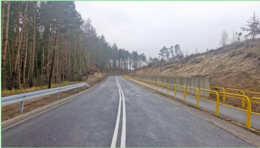
Nowa droga do Tucholi.

Realizacja ostatniego etapu budowy ścieżki rowerowej Tuchola – Cekcyn - długość odcinka: 4.218 m, wartość projektu: 4.686.099,98 zł, wysokość wkładu z Funduszy Europejskich: 4.686.099 zł, wkład własny Powiatu Tucholskiego: 826.958 zł, termin realizacji: do 30.11.2025 r.