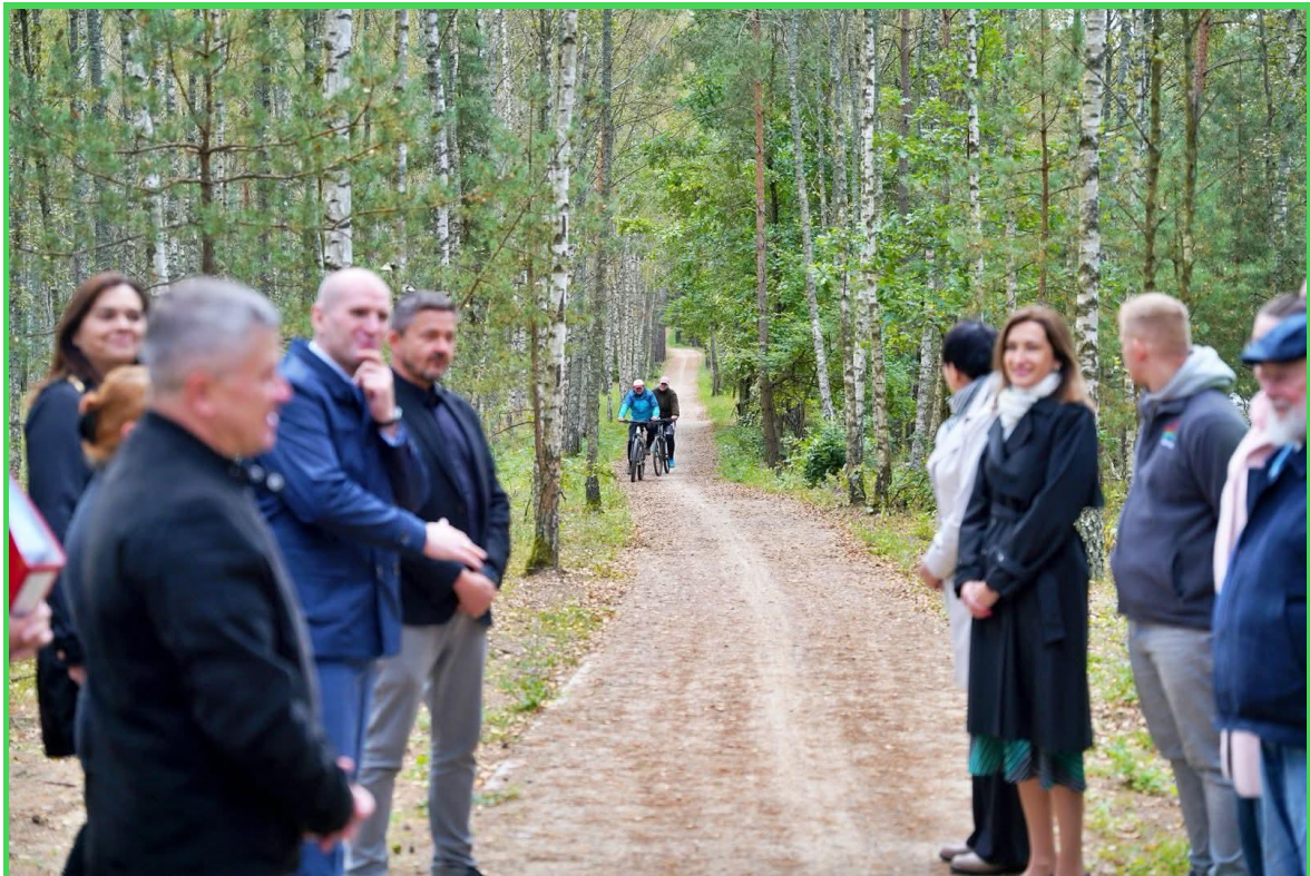
Otwarcie ścieżki rowerowej – 29 września 2025 r.

Realizacja ostatniego etapu budowy ścieżki rowerowej Tuchola – Cekcyn - długość odcinka: 4.218 m, wartość projektu: 4.686.099,98 zł, wysokość wkładu z Funduszy Europejskich: 4.686.099 zł, wkład własny Powiatu Tucholskiego: 826.958 zł, termin realizacji: do 30.11.2025 r.