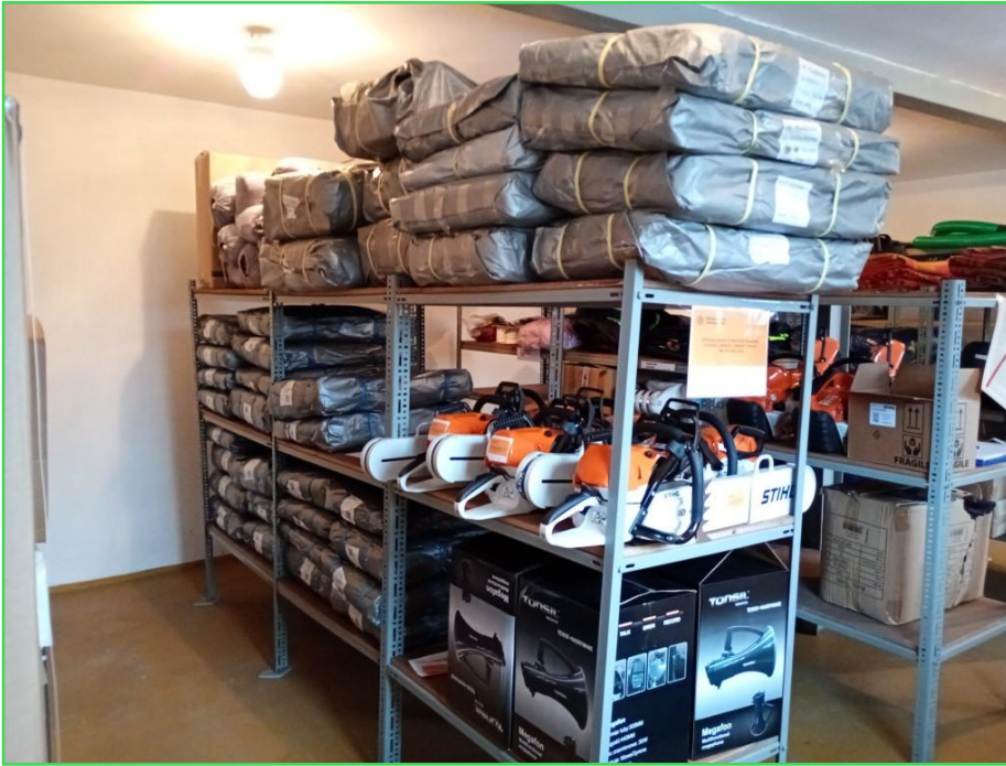
Wyposażenie magazynu OC

Wskazany w Strategii Rozwoju Gminy Cekcyn cel strategiczny zdefiniowany w wymiarze gospodarczym zakłada, że gmina powinna opierać swój wzrost gospodarczy w oparciu o zasoby endogeniczne, które stanowią m. in. unikatowe walory przyrodnicze i środowiskowe.