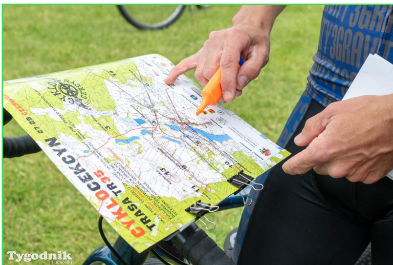
Przebieg trasy rowerowej 35 km