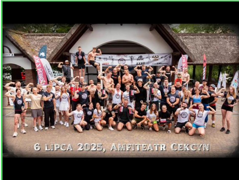
Uczestnicy zawodów - Straight Ouuta Battle

Po raz trzeci, w dniach 27-28 lipca odbyła się w cekcyńskim amfiteatrze letnia edycja ogólnopolskich zawodów Straight Outta Battle (zawody w kalistenice).