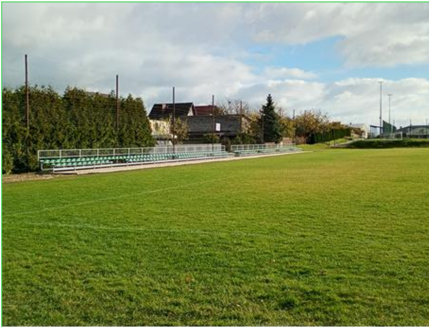
Nowe trybuny na boisku w Cekcynie

Wartość zadania wyniosła 140.072,40 zł brutto przy dofinansowaniu ze środków Województwa w wysokości 56.028,96 zł.