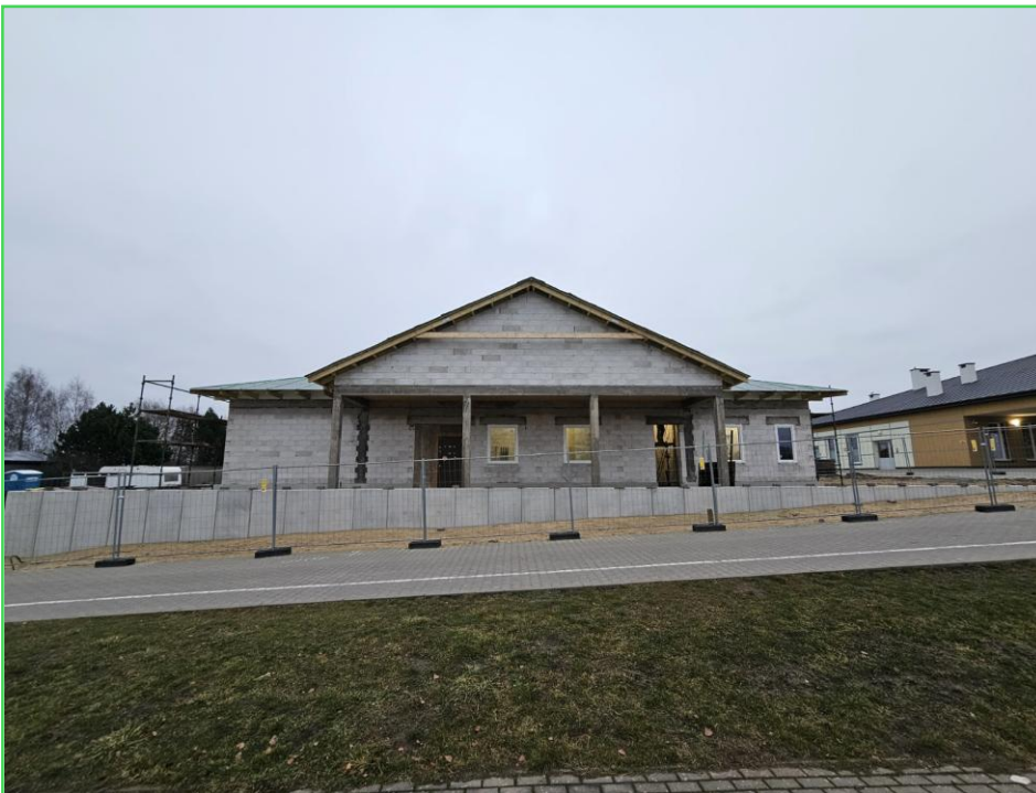
Plac budowy żłobka

Dofinansowanie na utworzenie miejsc opieki: 3.396. 453,00 zł z czego: 2.761.344,00 zł – Krajowy Plan Odbudowy i 635.109 zł – Budżet Państwa. Dodatkowo projekt zakłada dofinansowanie na funkcjonowanie miejsc opieki (36 msc): 1.444.608,00 zł ze środków Funduszy Europejskich dla Rozwoju Społecznego.