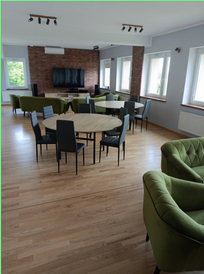
Dzienny Dom Pomocy po remoncie

Ochrona zdrowia – w tym zakresie realizacja Strategii przedstawiała się następująco: