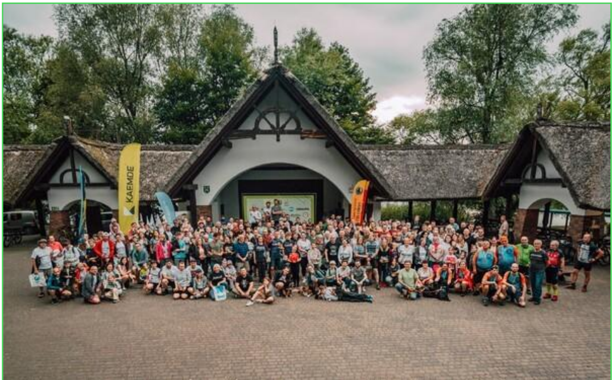
Uczestnicy rajdu CycloCekcyn2025

W dniach 28-29 czerwca GLKS „Cis Cekcyn” wraz z Gminą Cekcyn i Gmina Lubiewo, po raz kolejny zorganizował duże wydarzenie sportowe, zaliczane do Pucharu Polski w Pieszych maratonach na Orientację. Rajd „CycloCekcyn” w ubiegłym roku wystartował w dwóch dyscyplinach: biegu i jazdy rowerem na orientację. Dla uczestników przygotowano 6 tras, w tym 3 piesze ( 15 km, 25 km, 50km) i 3 rowerowe (40 km, 50 km, 100 km).