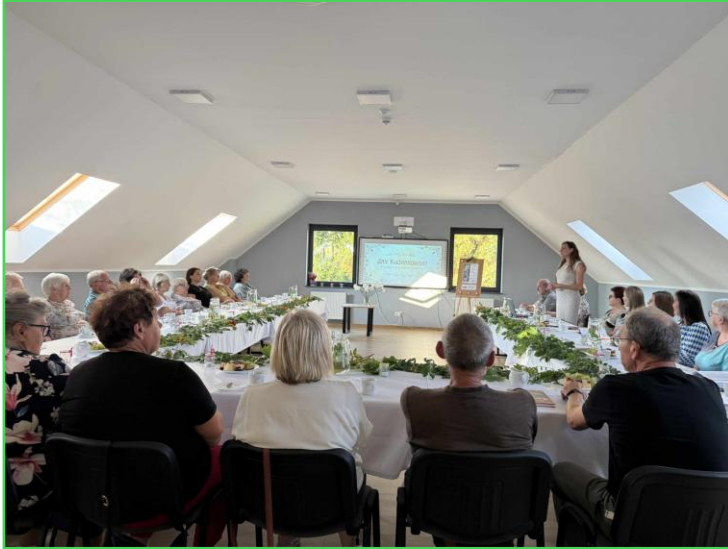
Narodowe Czytanie 2025

• we wrześniu biblioteka włączyła się do ogólnopolskiej akcji Narodowego Czytania. Lekturą roku 2025 były utwory Jana Kochanowskiego, które czytały osoby zaprzyjaźnione z biblioteką. Spotkanie zorganizowane zostało w Centrum Usług Społecznych Hopland w Cekcynie. Uczestnicy otrzymali pamiątkowe książki,