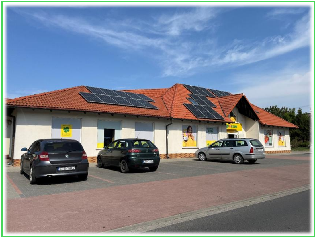
Zakupiony budynek pod usługi rehabilitacji

W ramach rozwoju wysokiej jakości usług medycznych Gmina Cekcyn w 2025 roku kupiła budynek po byłym sklepie z przeznaczeniem na rehabilitację. Trwają prace projektowe nad przebudową pomieszczeń.